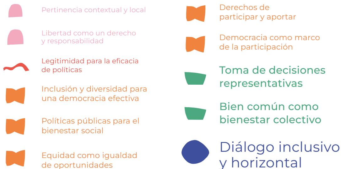
Gráfico N° 2: Conceptos destacados en la comprensión de la participación ciudadana por los y las participantes de los Encuentros Participativos