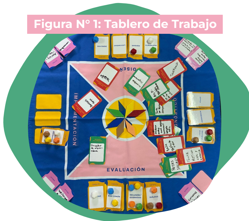
Figura N° 1: Tablero de Trabajo